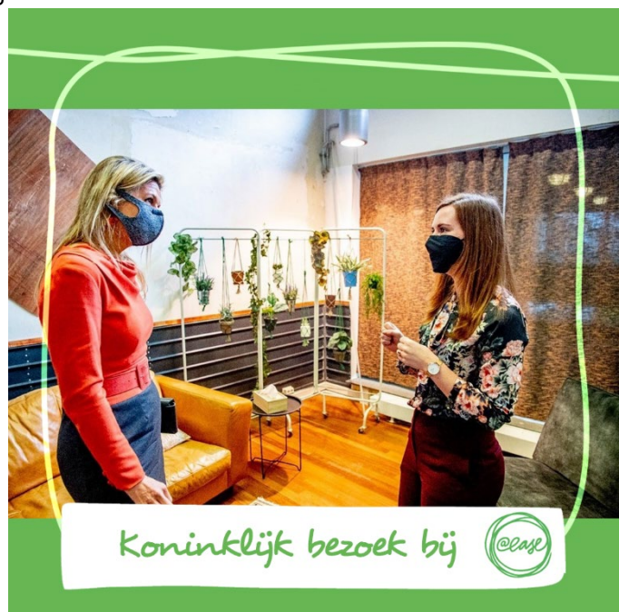
Koninklijk bezoek bij

In 2021 startte ook het project 'Everybody @ease' via een gehonoreerde subsidieaanvraag van FNO. Via dit project zetten we nog meer in op het bereiken van jongeren die we nu nog niet bij @ease zien en waarvoor we preventief willen opschalen. Via een pilot in Zuid-Limburg en Amsterdam zoeken we deze jongeren op (via een outreachende variant van @ease) bij hun (MBO)school en in de wijk i.s.m. lokale partners. Uiteindelijk is het doel deze jongeren vroeg in beeld te krijgen en via @ease en de samenwerkende lokale partners hulp op maat te bieden.